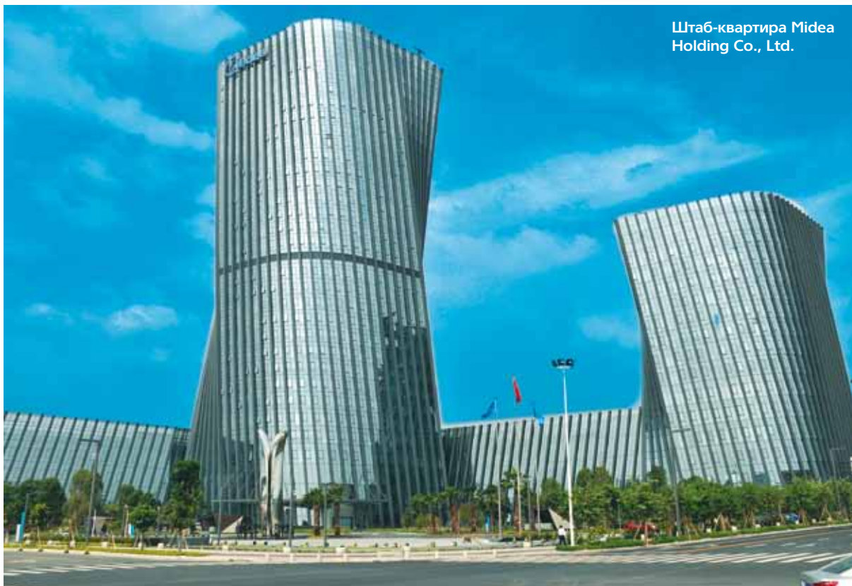
Штаб-квартира Midea Holding Co., Ltd.