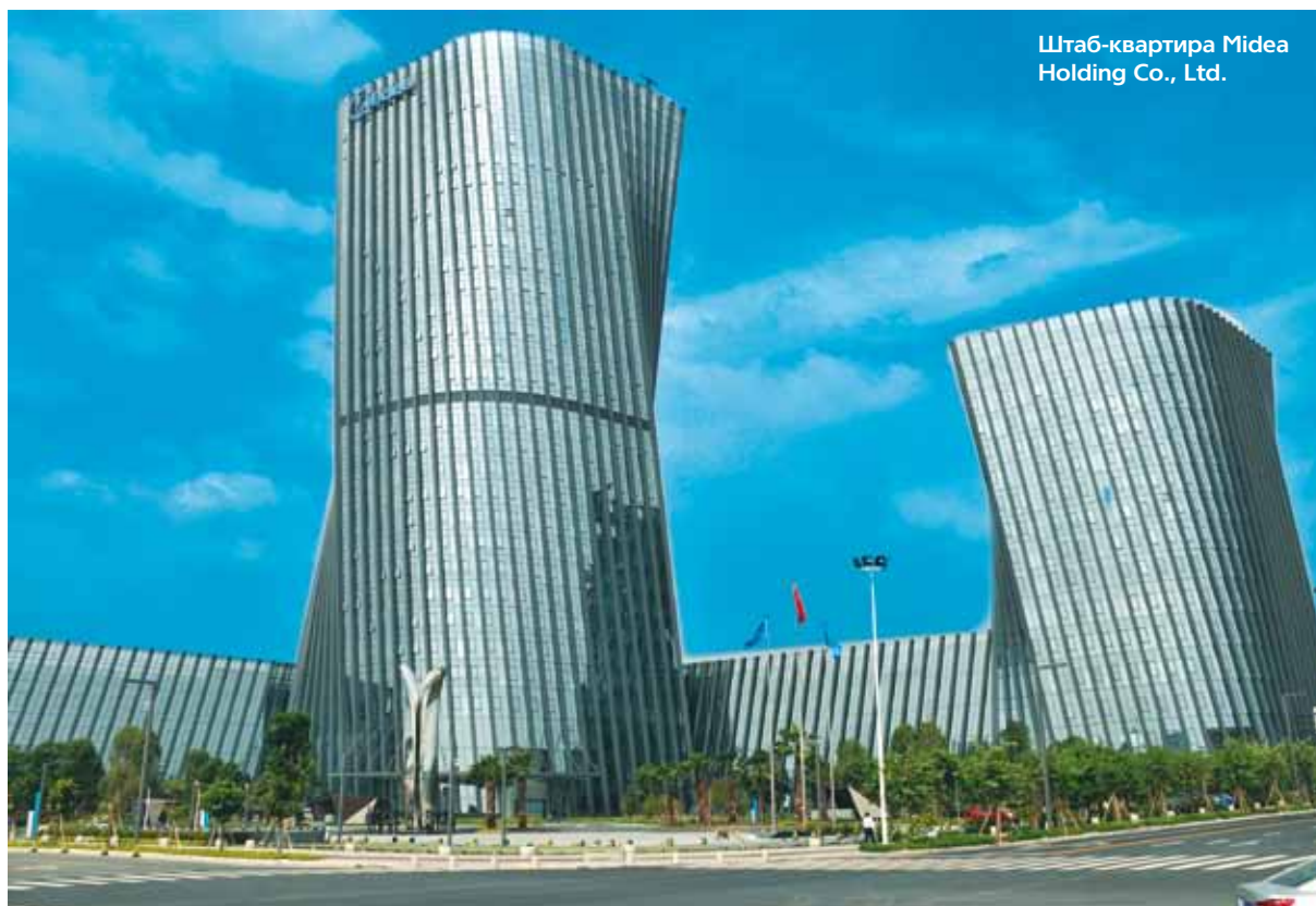
Штаб-квартира Midea Holding Co., Ltd.